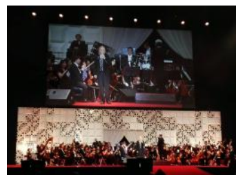
インターナショナルショー 谷村新司が出演