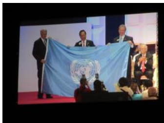
国連より、ライオンズクラブに 国連機を贈呈