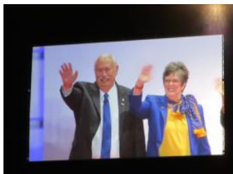
次期国際会長ご夫婦の発表