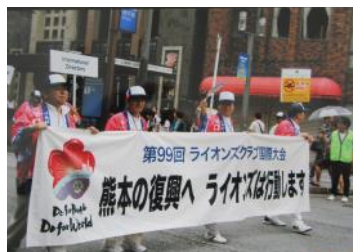
熊本の復興へ ライオンズは行動 しますの横断幕