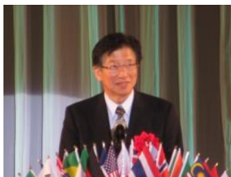
来賓に祝辞を静岡県知事川勝平太 様が行う