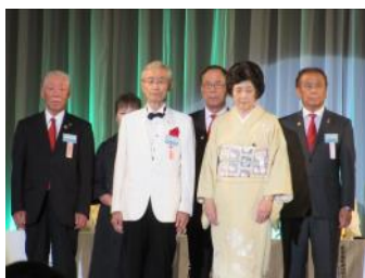
334-A地区次期キャビネットチーム