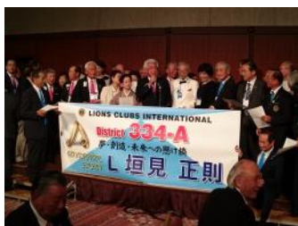
地区ガバナーエレクト晩餐会