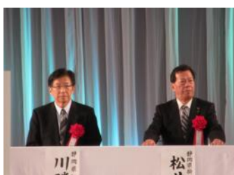
静岡県知事川勝平太様、掛川市長松井三郎様