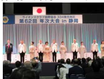
ガバナー協議会構成員入場・紹介