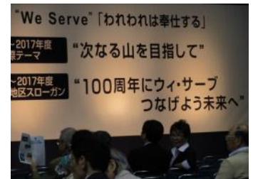
地区スローガンの発表「100周年にウィサーブ つなげよう未来へ」