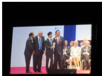
国境なき医師団に感謝状の贈呈