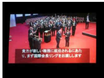
国際会長就任にあたり、国際会 長リングの贈呈