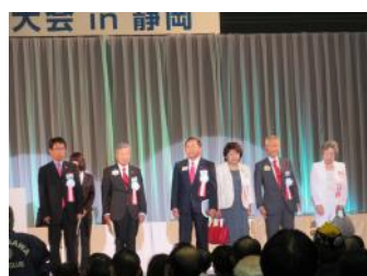
大会顧問の皆さん