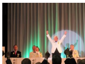
334-A地区全員でライオンズローア