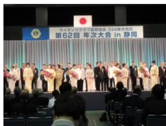
334-A～334-E地区次期キャ ビネット構成員