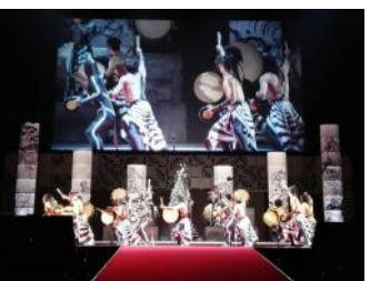
パフォーマンス集団「DRUM TAO」