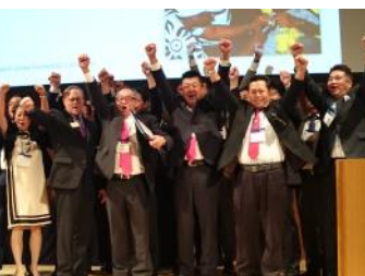
メルビン・ジョーンズ・フェロー 屋食会にて334-A地区1R2Z名 古屋シティLCが表彰される