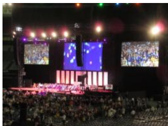
オープニング・セレモニー