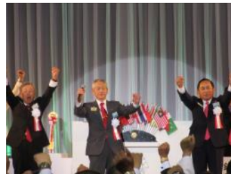
大会顧問のライオンズローア