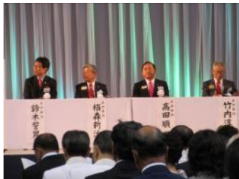
大会顧問の皆さん