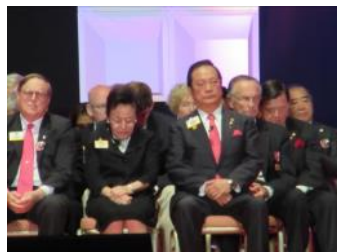
壇上には元国際会長が並んで着席