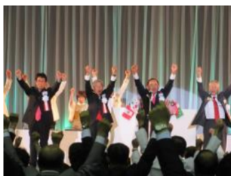
大会顧問に依るウィ・サーブの三唱