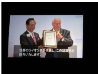
前会長L山田より認証状を授与