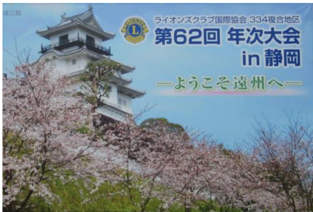
エコパアリーナ前では「ようこそ遠州へ」の大きな看板がお出迎え

6月5日(日) 334複合地区第62回年次大会が静岡県小笠山総合運動公園「エコパアリーナ」で開催されました。