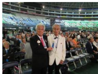
ガバナーエレクトのリボンを取 る